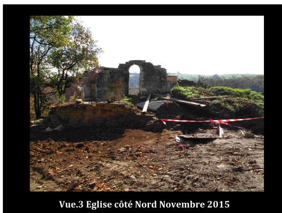
Vue.3 Eglise côté Nord Novembre 2015