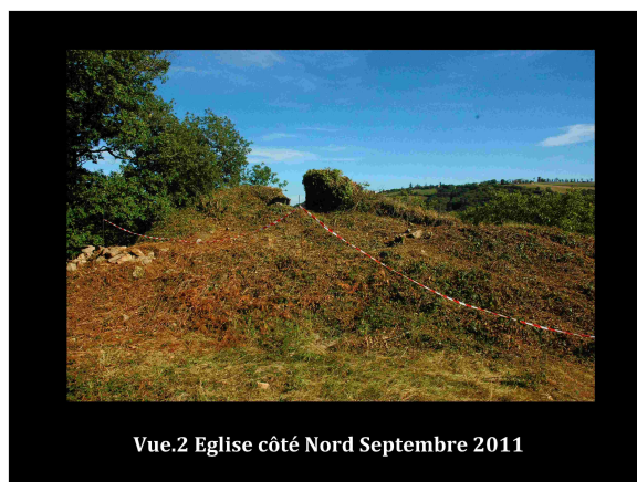
Vue.2 Eglise côté Nord Septembre 2011