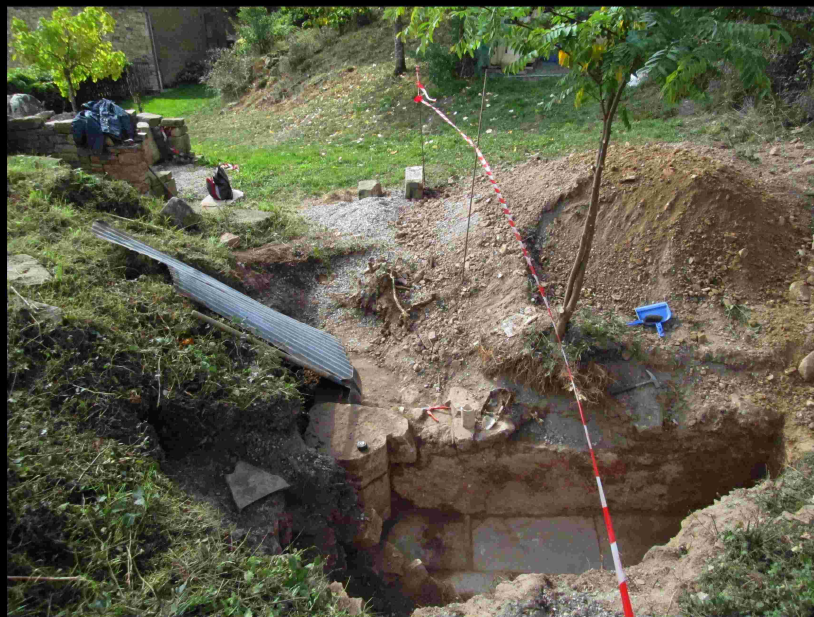
Vue.6 Mur intérieur Nord-Ouest Chapelle Octobre 2015