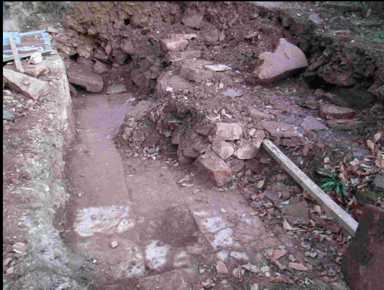
Vue.8 Entrée Nord-Ouest Chapelle Novembre 2015

- L'entrée unique côté Ouest a été partiellement mise à jour et nous laisse enfin apprécier la largeur originelle du corps principal de l'église, (le dallage a partiellement souffert de la chute de pans de murs mais est encore présent).