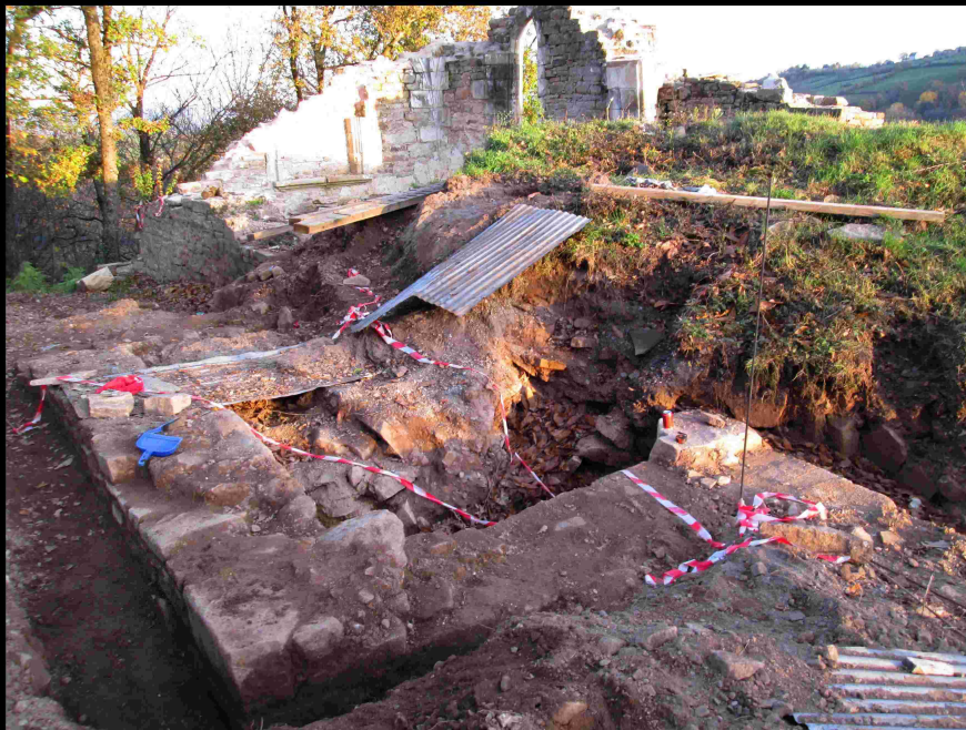
Vue.8 Angle Extérieur Nord-Ouest Octobre 2015

- L'entrée unique côté Ouest a été partiellement mise à jour et nous laisse enfin apprécier la largeur originelle du corps principal de l'église, (le dallage a partiellement souffert de la chute de pans de murs mais est encore présent).