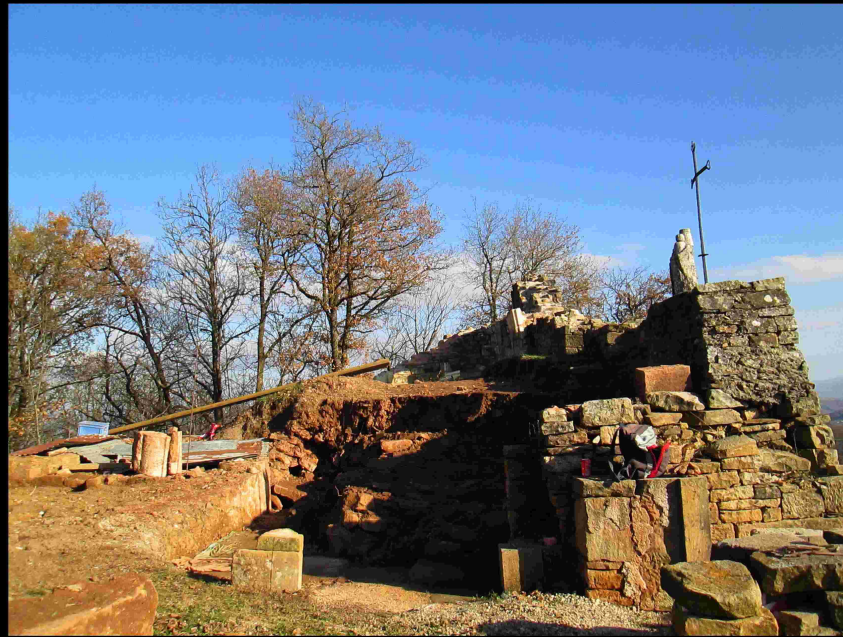
Vue.9 Entrée Eglise Novembre 2015