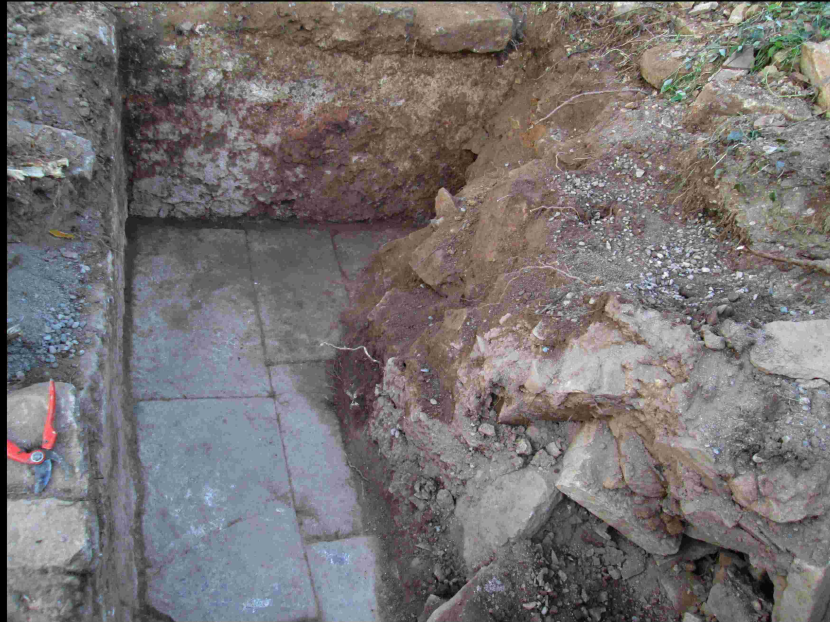
Vue.6 Angle Intérieur Nord-Ouest Chapelle

- Suite à la continuation du dégagement des murs extérieurs et intérieurs Nord, la chapelle a émergée et on peut en voir le dallage en très bon état malgré les gravats et pierres accumulés en désordre par les démolisseurs.