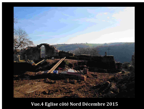
Vue.4 Eglise côté Nord Décembre 2015

- Le mur Nord-Est extérieur de l'église a été entièrement dégagé, redonnant ainsi le volume d'ensemble de la bâtisse en ruine.